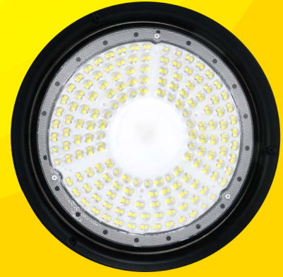
200W 6.500°K | 24.000lm