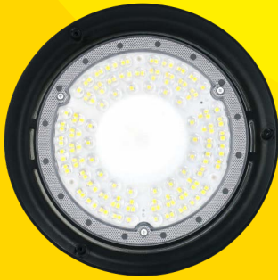
100W 6.500°K | 12.000lm