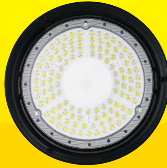
150W 6.500°K | 18.000lm